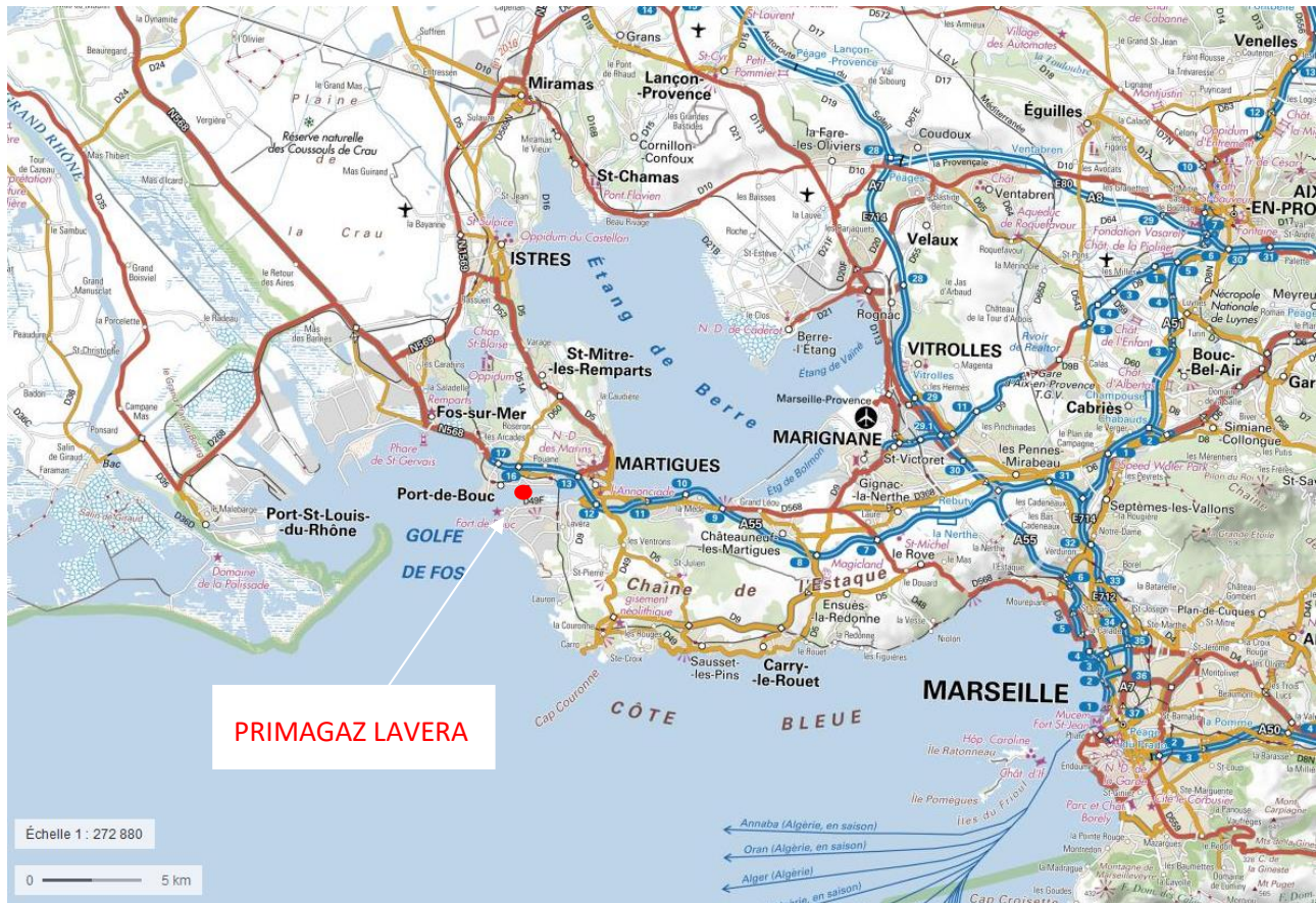
Figure 1 : Localisation du site PRIMAGAZ LAVERA – Carte IGN

Le stockage de PRIMAGAZ LAVERA est situé dans les Bouches-du-Rhône, sur la commune de Port-de-Bouc, entre l'Étang de Berre et le Golfe de Fos.